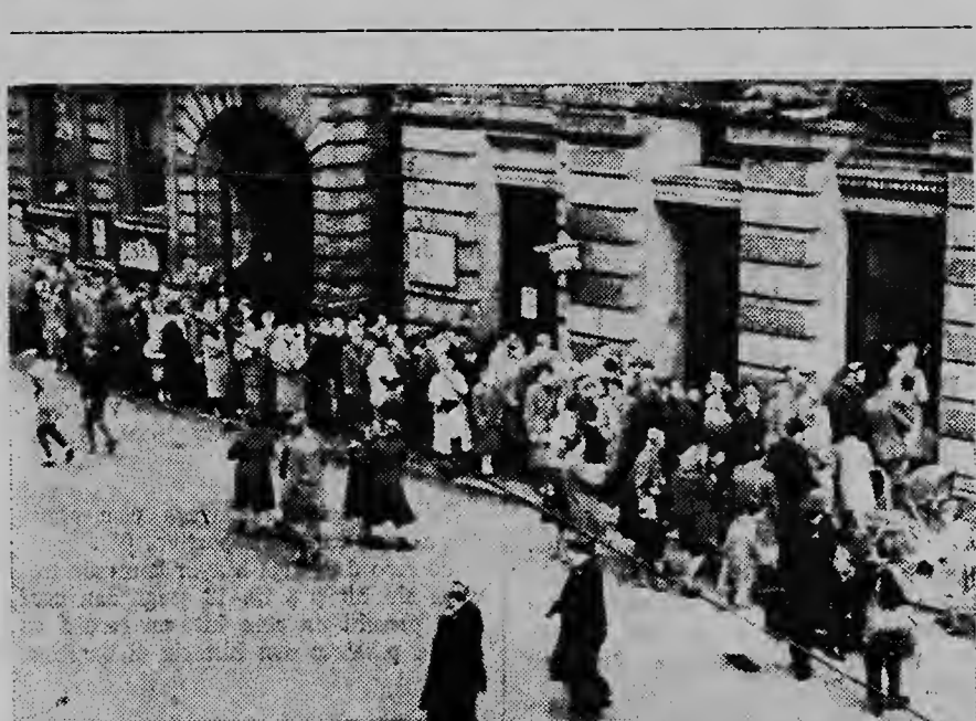
Miles inglesnan a probecha dje ocasion pa bai enter contra brohera. Na Bradford, ya tin cinco hende gravemente malo